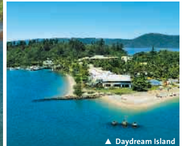
▲ Daydream Island

1. Tag: Sydney - Hunter Valley Sie verlassen Sydney über die Harbour Bridge. Auf dem Pacific Highway und Newcastle kurze Fahrt ins bekannte Weinanbaugelände Hunter Valley, wo Sie heute übernachten.