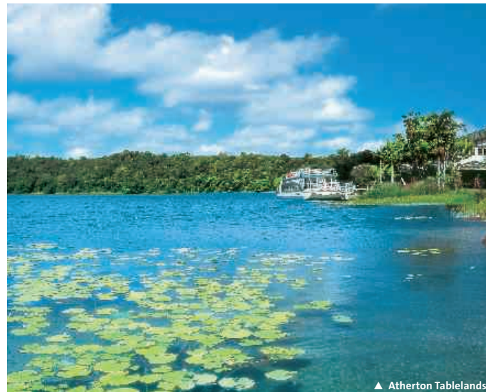
▲ Atherton Tablelands