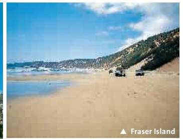
▲ Fraser Island