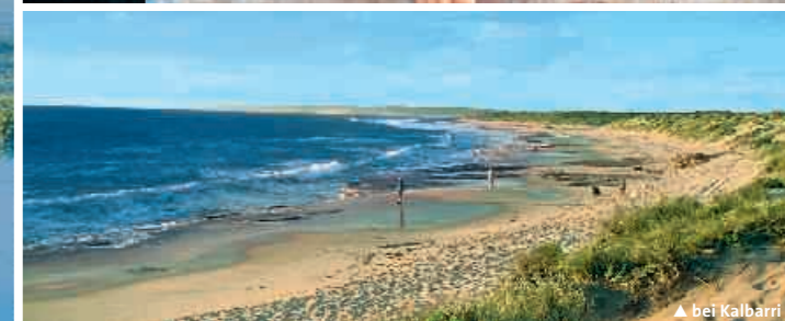
▲ bei Kalbarri