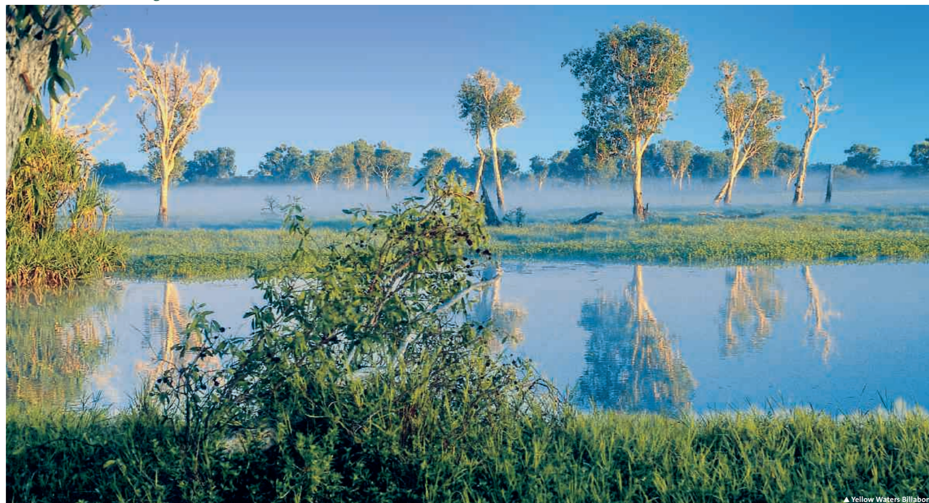
▲ Yellow Waters Billabong

19 Tage/18 Nächte oder 11 Tage/10 Nächte ab Perth bis Darwin oder Broome oder umgekehrt