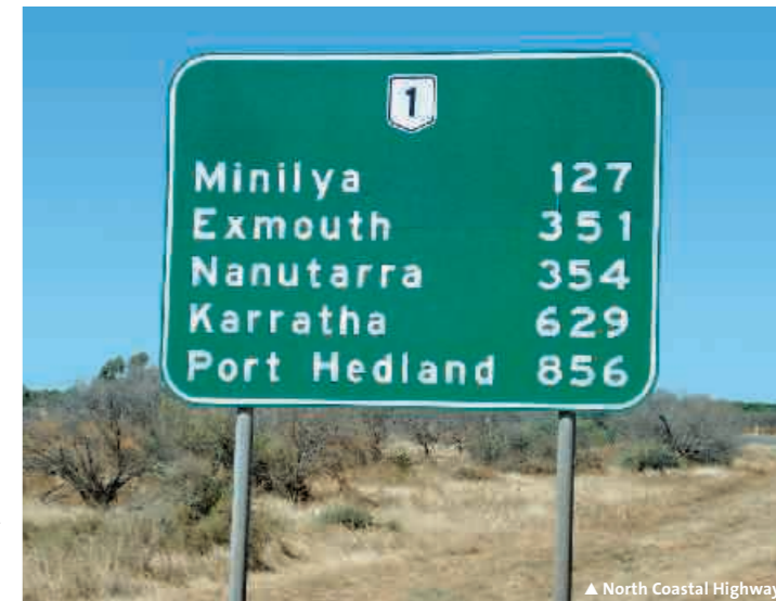
▲ North Coastal Highway