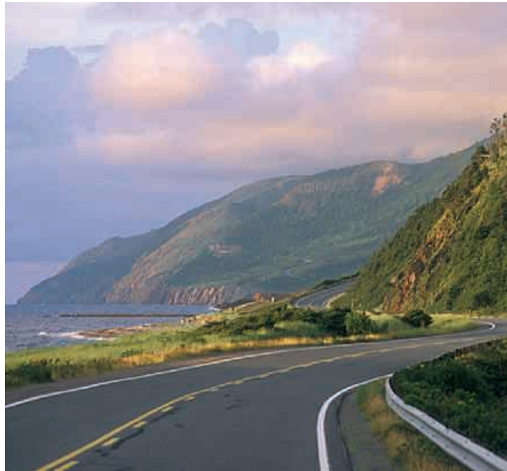
▲ Nova Scotia