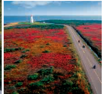
▲ New Brunswick