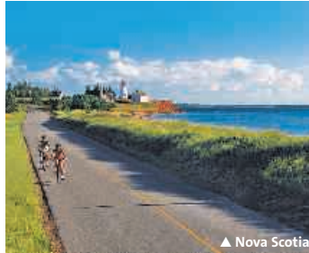
▲ Nova Scotia