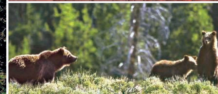
▲ Bärenfamilie in den Rocky Mountains

staaten begleiten. Tagesziel ist Sheridan, eine ursprüngliche Westernstadt im Norden Wyoming.