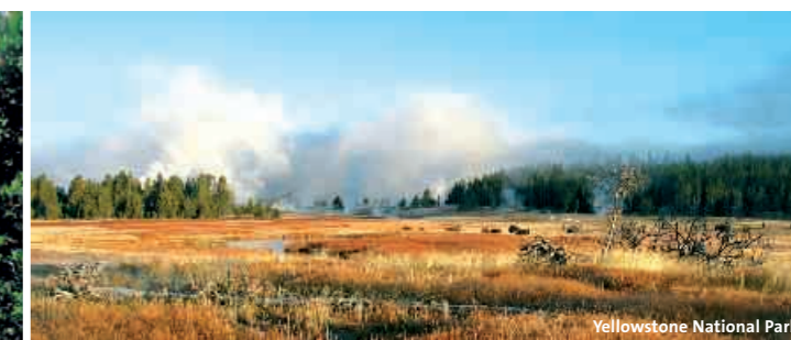
Yellowstone National Park