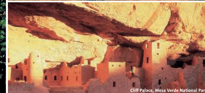
Cliff Palace, Mesa Verde National Park