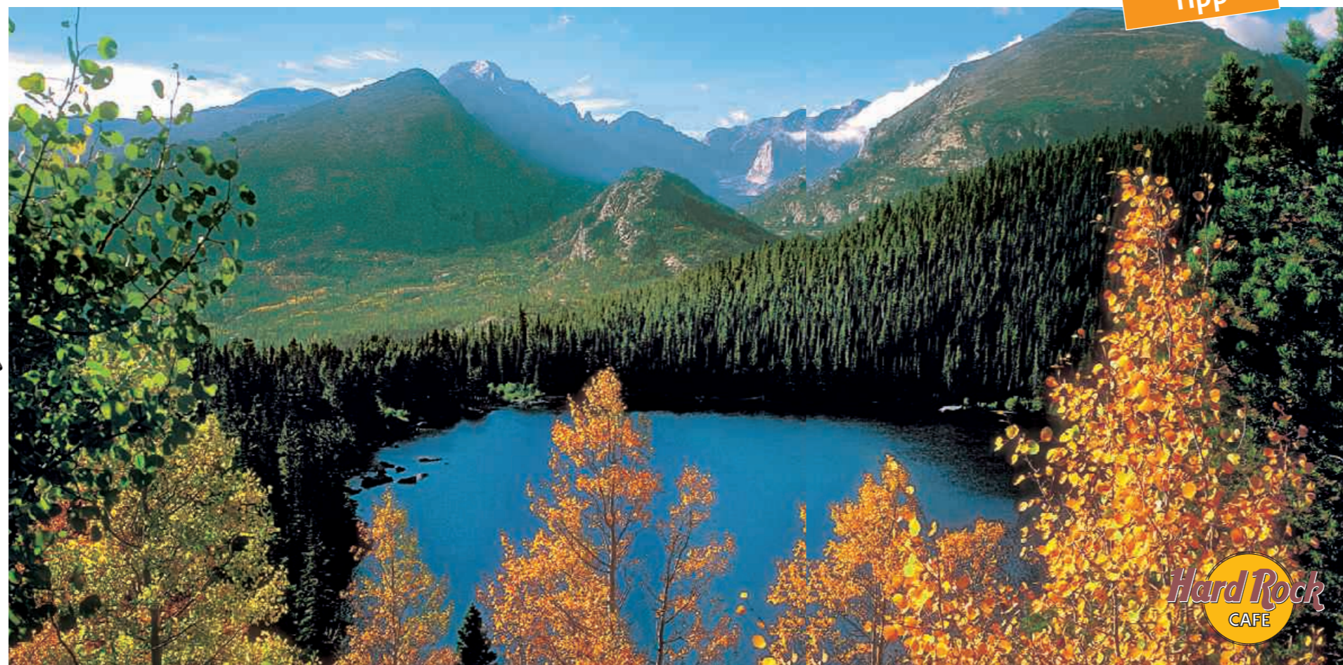
▲ Rocky Mountains Nationalpark

1. Tag: Ankunft in Denver Willkommen in Denver, der „Mile-High-City“ in Colorado. Übernehmen Sie Ihren Mietwagen am Flughafen und fahren Sie zum Hotel. Sie haben nun Zeit, um Denver mit seinen Sehenswürdigkeiten wie z.B. dem Denver Arts Museum des berühmten Architekten Daniel Libeskind oder dem Capitol zu besuchen. Verpassen Sie auch nicht den nahegelegenen Rocky Mountain Nationalpark. Der über 10.758 ft. hohe Millner Pass teilt den Park in West- und Ostteil. Unzählige Gipfel, Seen, Wanderwege und eine faszinierende Tierwelt machen diesen Park aus.