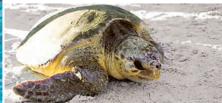
▲ Meeresschildkröte am Strand

„Schwimmen mit Delphinen“ bietet das Seaquarium ein „Once in a Lifetime Erlebnis“ an. Allabendlich können Sie den beeindruckenden Sand-skulpturenkünstlern am Strand des belebten, bunt beleuchteten Ocean Drives über die Schulter schauen.