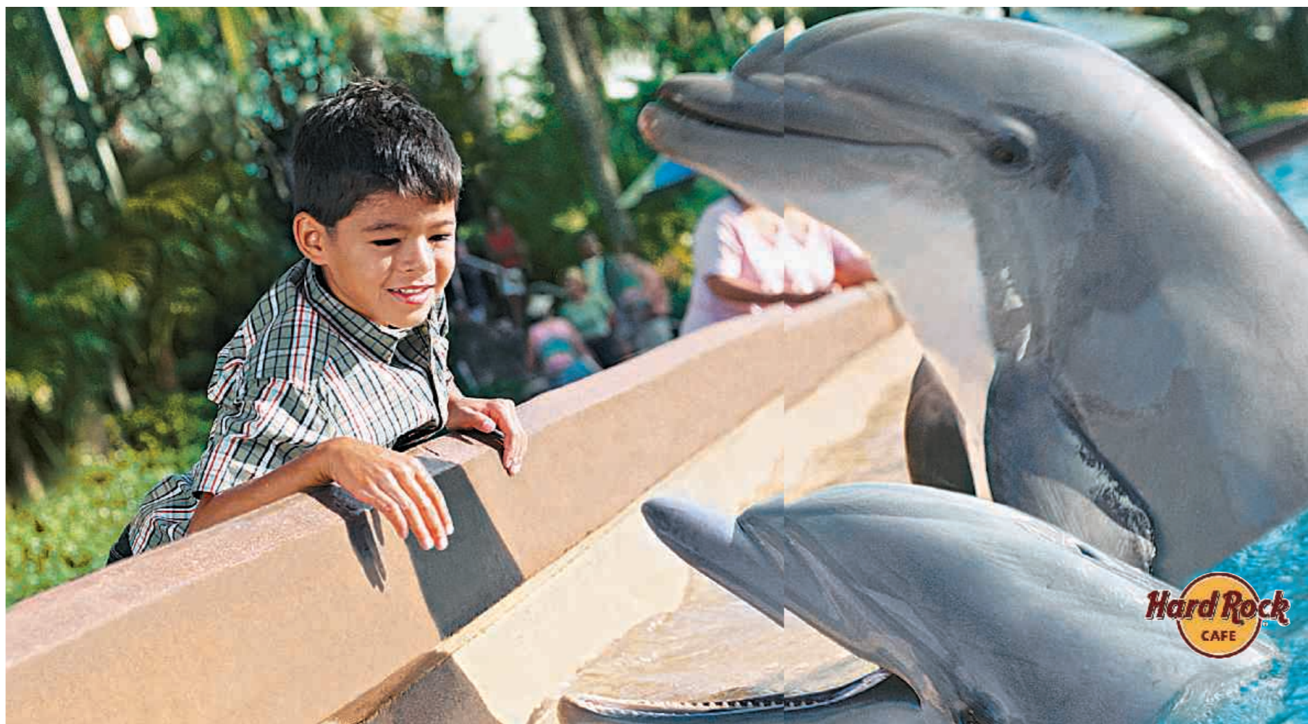
▲ Delfine in einem Themenpark