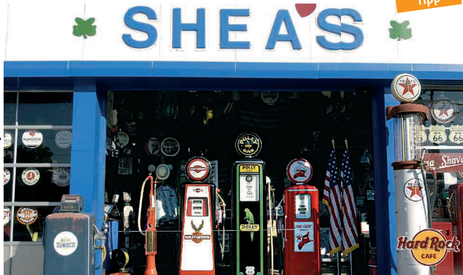
▲ Historic Route 66, National Scenic Byway

17 Tage/16 Nächte ab Chicago bis Los Angeles