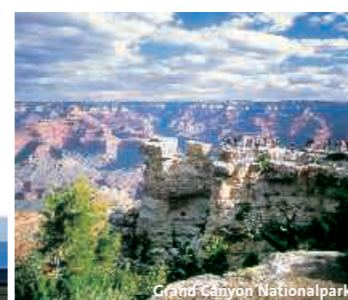
Grand Canyon Nationalpark