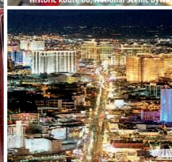
▲ Las Vegas, Strip