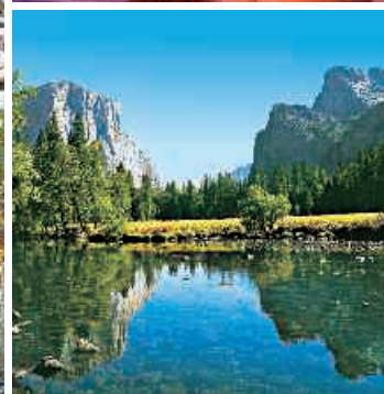
▲ Yosemite Nationalpark, El Capitan